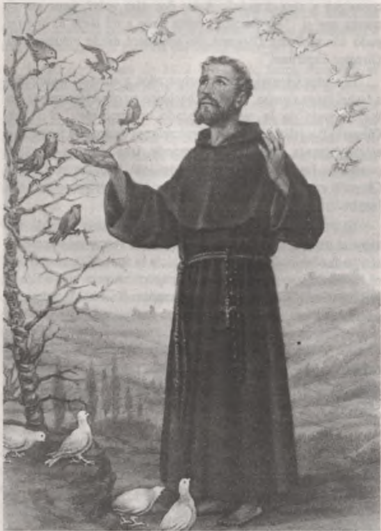
San Francisco de Asís, bajo cuya protección se funda la Congregación y de quien asume su espiritualidad

entregarse a sus hermanos y donde muchos hermanos necesitados pudieran sentir la ternura del Dios Padre que por este medio llegaba a ellos.