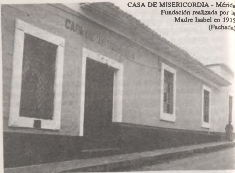
CASA DE MISERICORDIA - Mérida Fundación realizada por la Madre Isabel en 1915 (Fachada)