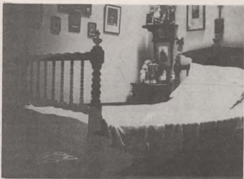
Arriba: Habitación de la Madre Isabel.