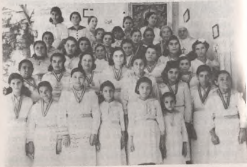
Empleadas Domésticas o "Hermandad de Santa Rita" de la Casa Misericordia de Mérida.