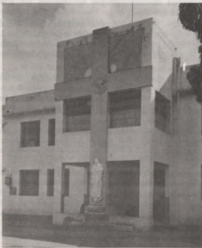
Colegio "Nuestra Señora de Guadalupe" Fundado en Caracas, Sabana Grande 1909 (Fachada del Edificio Actual)