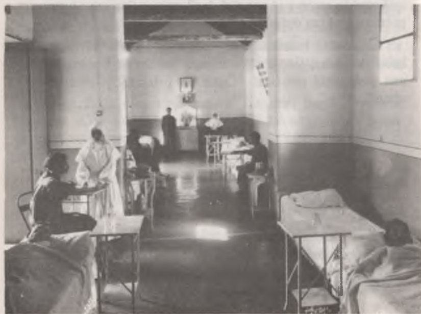
Hospital de Petare. Fundado en 1910. Pabellón de Hombres, donde se aprecia a las Hermanas en plena faena.