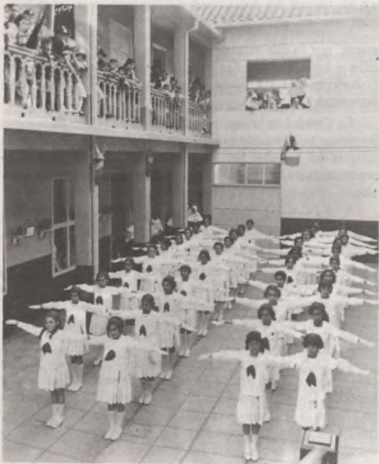
Colegio "San Antonio" - Patio Central. Alumnas en un acto de Fin de Curso