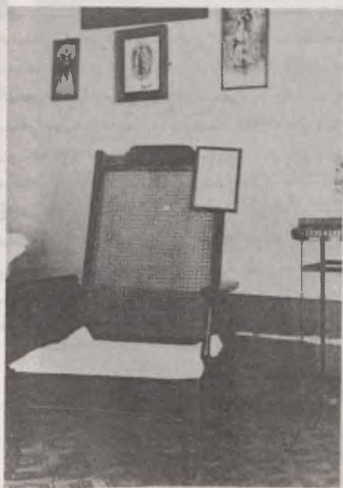
Abajo: Sillón donde, a pesar de sus do- lores, recibe la hermana muerta y entrega su alma al Padre a quien tanto amó.