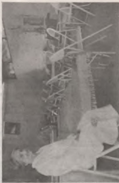
Diversos aspectos del Asilo "San Vicente de Paúl" - 1927. Ciudad Bolívar.