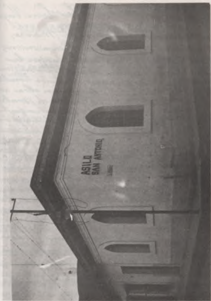
FACHADA DEL ASILO "SAN ANTONIO", DE VALENCIA